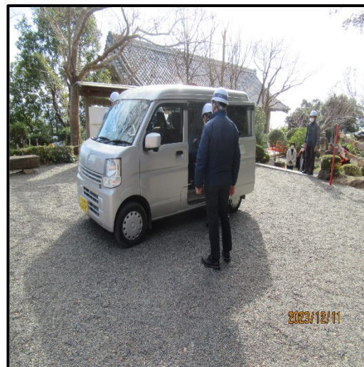
(車寄せから自動車で下山)