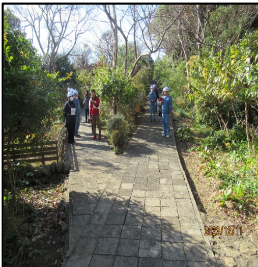
(山頂車寄せまで避難誘導)

山頂施設(テナント含む)の従業員を対象に、お客さまを下山用道路近傍の車寄せまで避難誘導し、自動車にて山麓まで移動する異常時対応を確認しました。