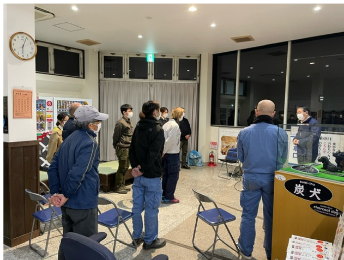
異常時対応訓練時の社長訓示

また、安全目標達成のため適時社内各部門を巡視、従業員の監督指導やコミュニケーションの確保に努めました。