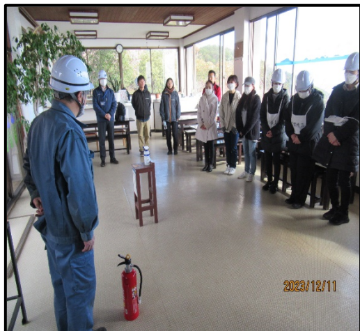
(消火器取り扱い方法の説明)

マニュアルに基づき消防署(119番)への通報訓練を行うとともに、消火器の取り扱い方法および設置場所の確認を行いました。