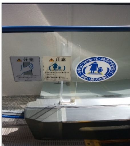
(エスカレーターの注意事項)