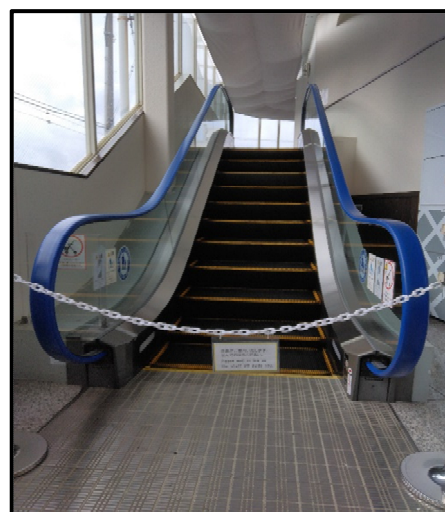
(エスカレーター乗車口)