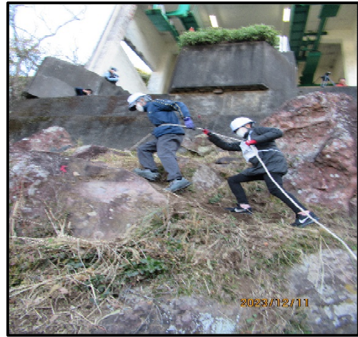
(救出したお客様を安全な場所に誘導)