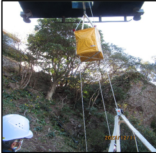
(応急下降器により搬器から救出)

搬器から地上に垂下させたロープを伝って搬器に急行した救助員は、応急下降器によりお客さまを地上へ救出、安全な場所まで誘導する対応を確認しました。